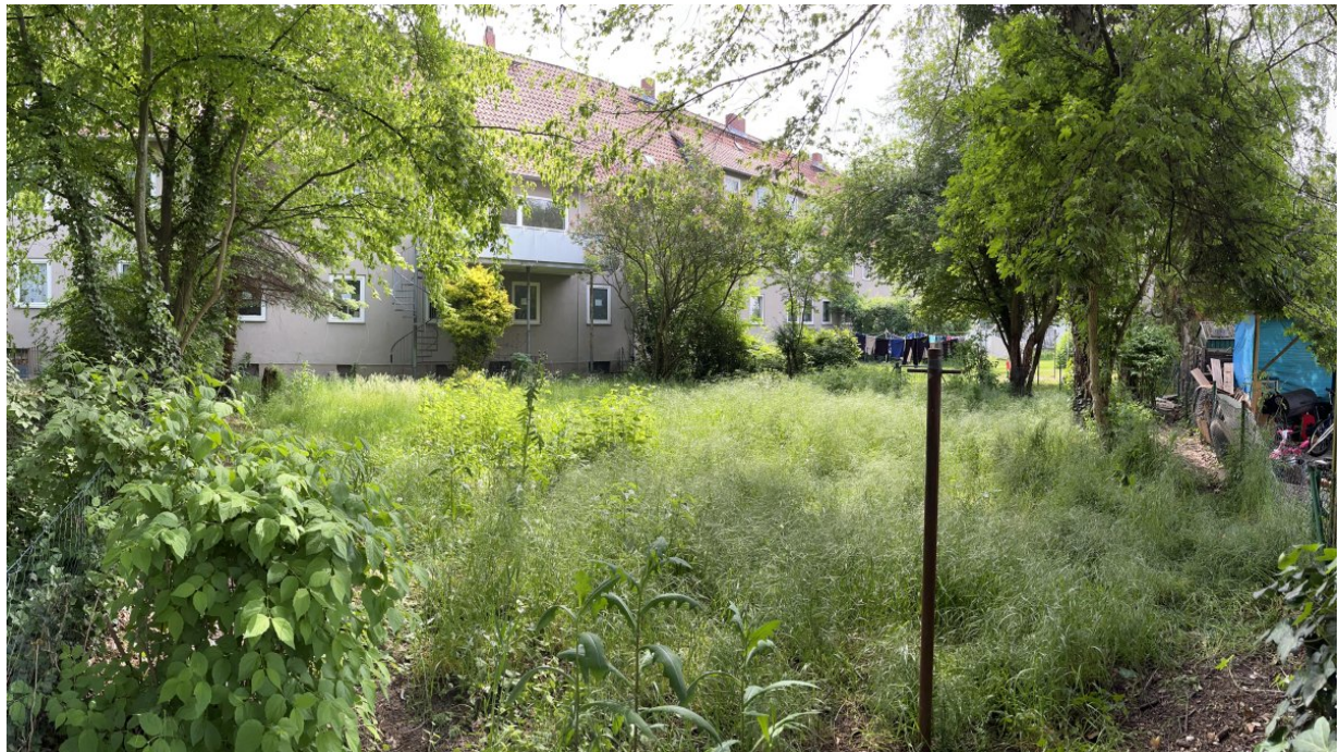
Der Garten der Bildungshelden soll Bienenhotels, eine neue Bepflanzung und Hochbeete erhalten.